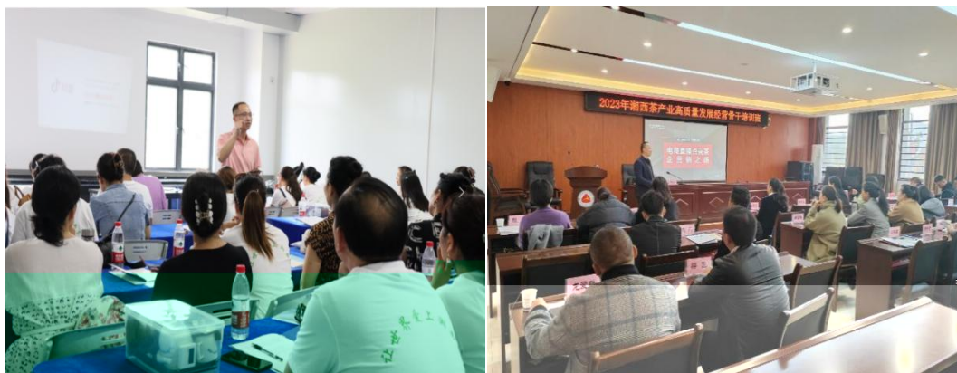
图 企业协助学校为湘西茶企开展电商直播培训

地的合，公不传 电，更关的创创。过大大 供创导，别茶工的操，公 鼓尝、敢创。方供锻 创的，方操的 合。