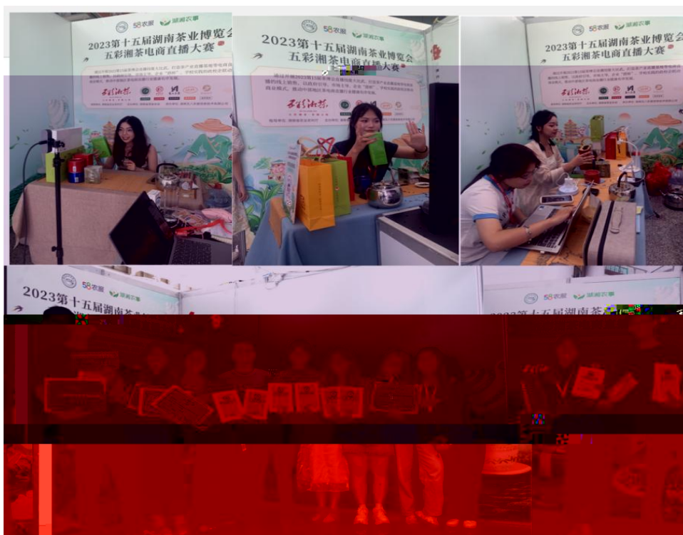
图 “湖南省第十五届茶博会” 电商直播比赛现场

播和方的，短 得的步。 队比10多单、单， 包但不、等多个，的 和队得的高度。的 得不对公的，更对参 付出和的充分定。