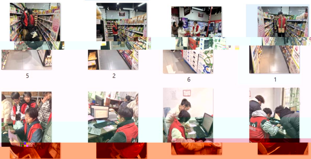
同学们在线下门店实训场景